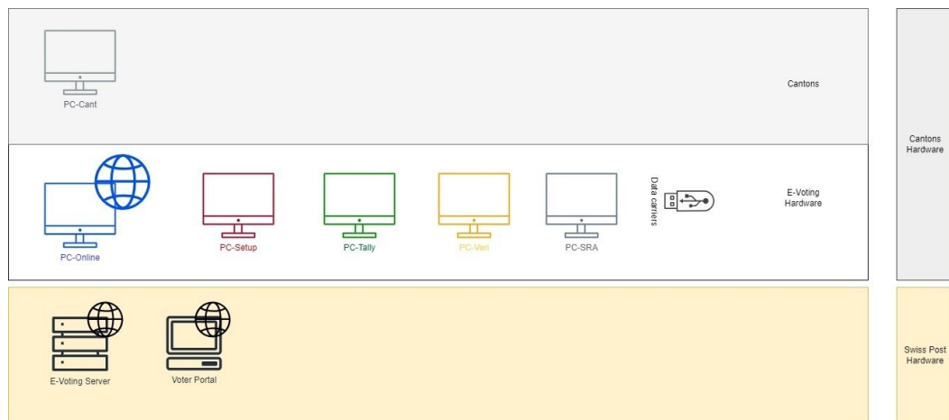
Abbildung 1: Komponenten E-Voting

Das produktive E-Voting System besteht aus den in Abbildung 1 aufgeführten Komponenten (siehe Abschnitt 4.1 ).